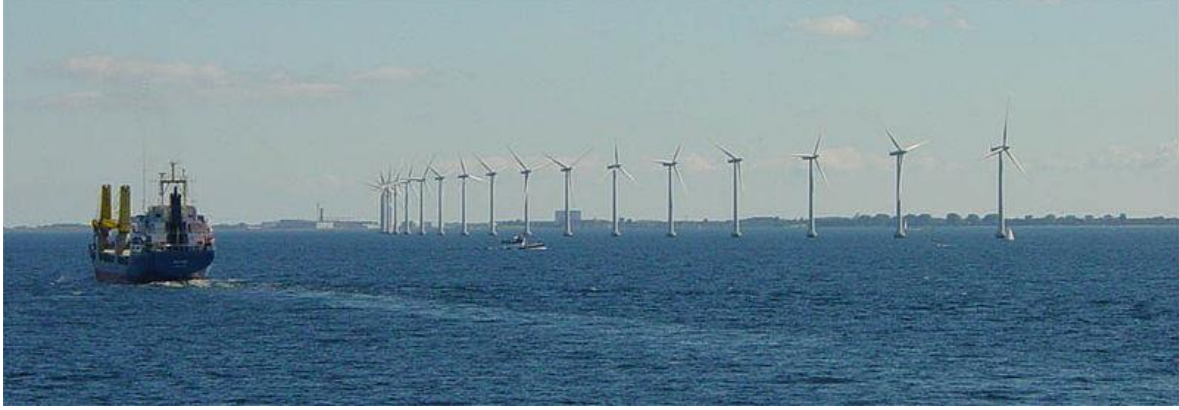
Şək. 2. Kopenhagen yaxınlığında külək turbinləri

Danimarka bu gün külək turbinləri hesabına istehsal etdiyi elektrik enerjisini əvvəllər enerji istehsal etmək üçün qaz aldığı İsveçrə və Almaniyaya satır.